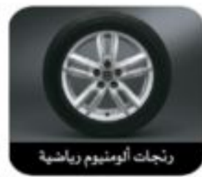
رنجات ألومنيوم رياضية