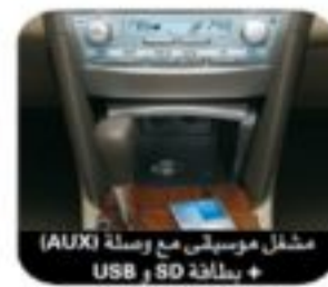
مشغل موسيقي مع وصلة USB وبطاقة SD

تويوتا أوريون 2011 ... تماماً كالنموذج العالي بطاقة جبارة تُعد هي أيضاً سر من أسرار القوة، معززة بمواصفات تكنولوجية متقدمة، وحزمة متكاملة من عناصر الفخامة والجمال الكلاسيكي. قلبها النابض هو محرك V6 بنظام VVT-i مزدوج سعة 3.5 لتر مع ناقل حركة إلكتروني ذو 6 سرعات بميزة تيبترونك لأداء أكثر سلاسة وقدرة أفضل على المناورة، فتبرز قوتها الكامنة التي تبهر العيون ... تويوتا أوريون الجديدة هي الأكثر تألقاً بفتنتها.